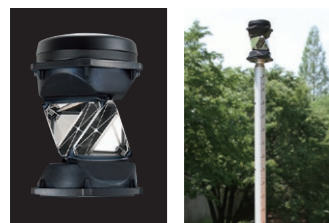
360° プリズム ATP2