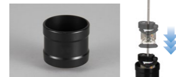
ATP ガード (360° プリズムプロテクター)