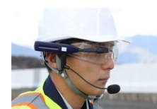
LN-150 ウェアラブルシステム 杭ナビ Vision