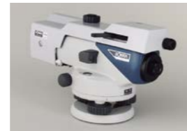
光学マイクロメーター OM5 (B2o)

接眼部に取付けることにより、90度方向からのぞくことができます。低位置での観測や、狭い場所での観測に便利です。