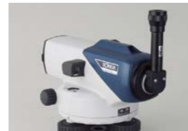
ダイアゴナルアイピース DE16 (B2o)

接眼部に取付けることにより、90度方向からのぞくことができます。低位置での観測や、狭い場所での観測に便利です。