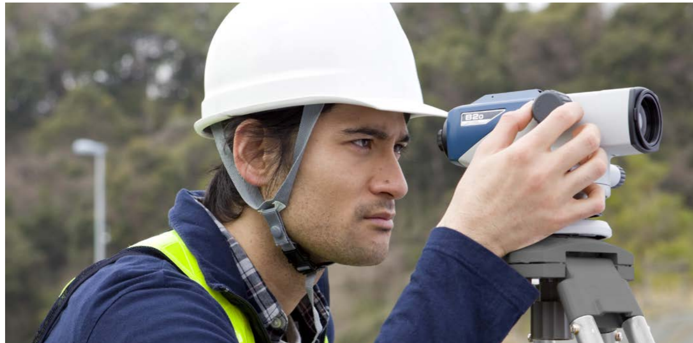
高倍率の高精度モデル