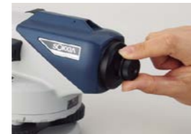
40x 接眼レンズ EL5 (B2o)

望遠鏡に光学マイクロメーターを取り付けることにより、0.1mm まで高さを読取ることが可能となります。精密水準測量、工作機械の据付等、高精度が要求される作業に活用いただけます。